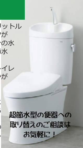
超節水型の便器への 取り替えのご相談は お気軽に！

☆TOTO ピュアレスト EX のタンク手洗いボウルが以前の機種より深くなりました！！手を洗っても水はねしにくくなりました。EX の機種は後ろ側トラップ部分の凸凹がカバーされていてお手入れしやすい便器です！