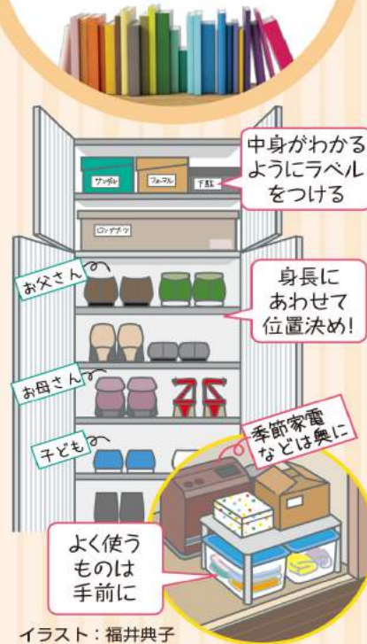
イラスト：福井典子