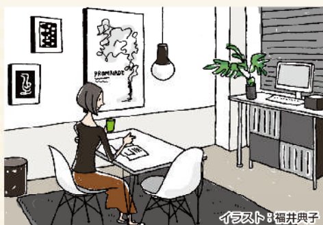
イラスト: 福井典子